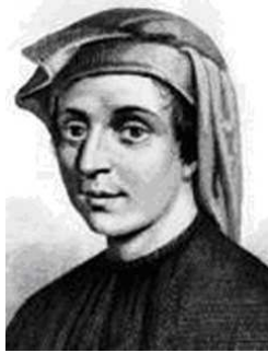
FIGURE 11.1 – Leonardo Fibonacci