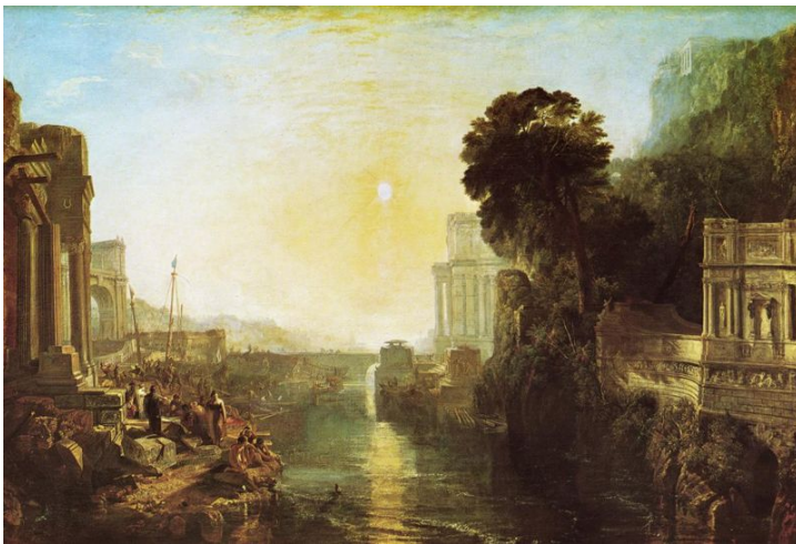
Didon construisant Carthage par Joseph Turner, 1815.