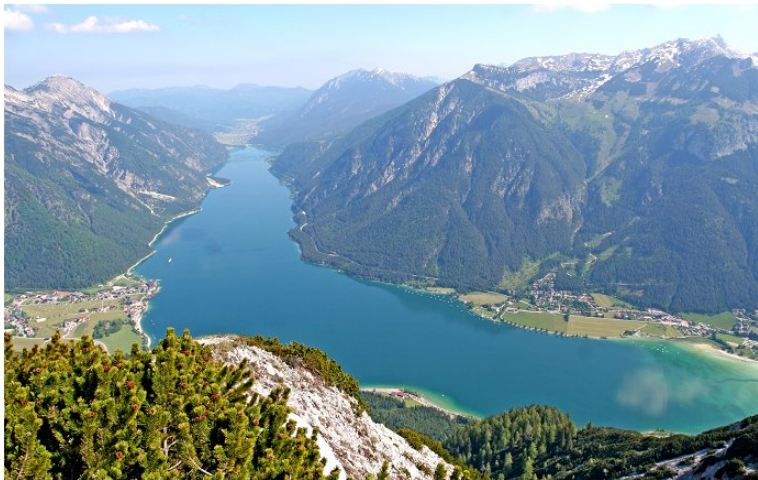
Le lac Achensee