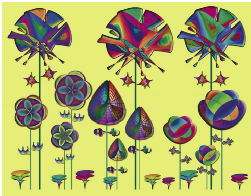
Surfaces de Dini et autres fleurs géométriques